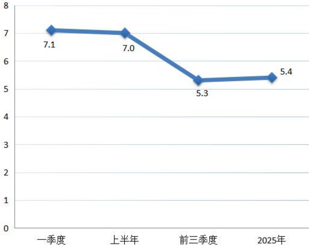
地区生产总值季度累计增长速度 (%)